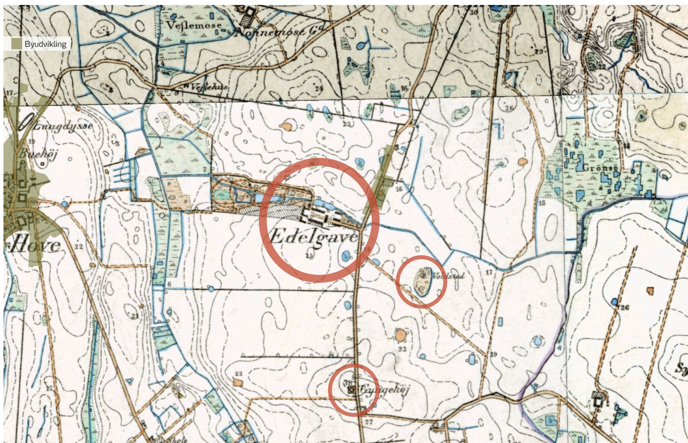
Historisk kort (1842-1899) med udpegning af herregården Edelgave, gravhøjen Gyngehøj og Smørholm Voldsted. Byudviklingen ved Hove og Edelgave Huse er også markeret på kortet.

Der er ikke offentlig adgang til Edelgave, men man kan besøge gårdspladsen samt Smørholm Voldsted og Gyngehøj.