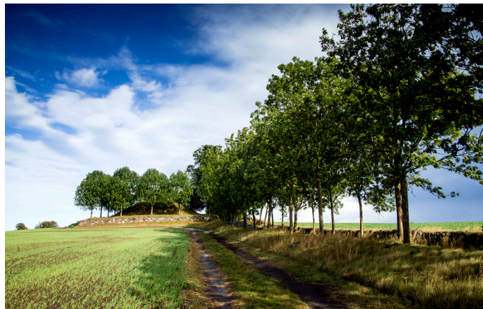
Sti langs den fredede allé ved Edelgavevej, der leder hen til gravhøjen Gyngehøj.

I den sydlige del af Egedal og flot placeret i et tydeligt herregårdslandskab med stensat allé og vejtræer findes herregården Edelgave, opført i nyklassicistisk stil i årene 1782-91 af arkitekt Andreas Kirkerup.